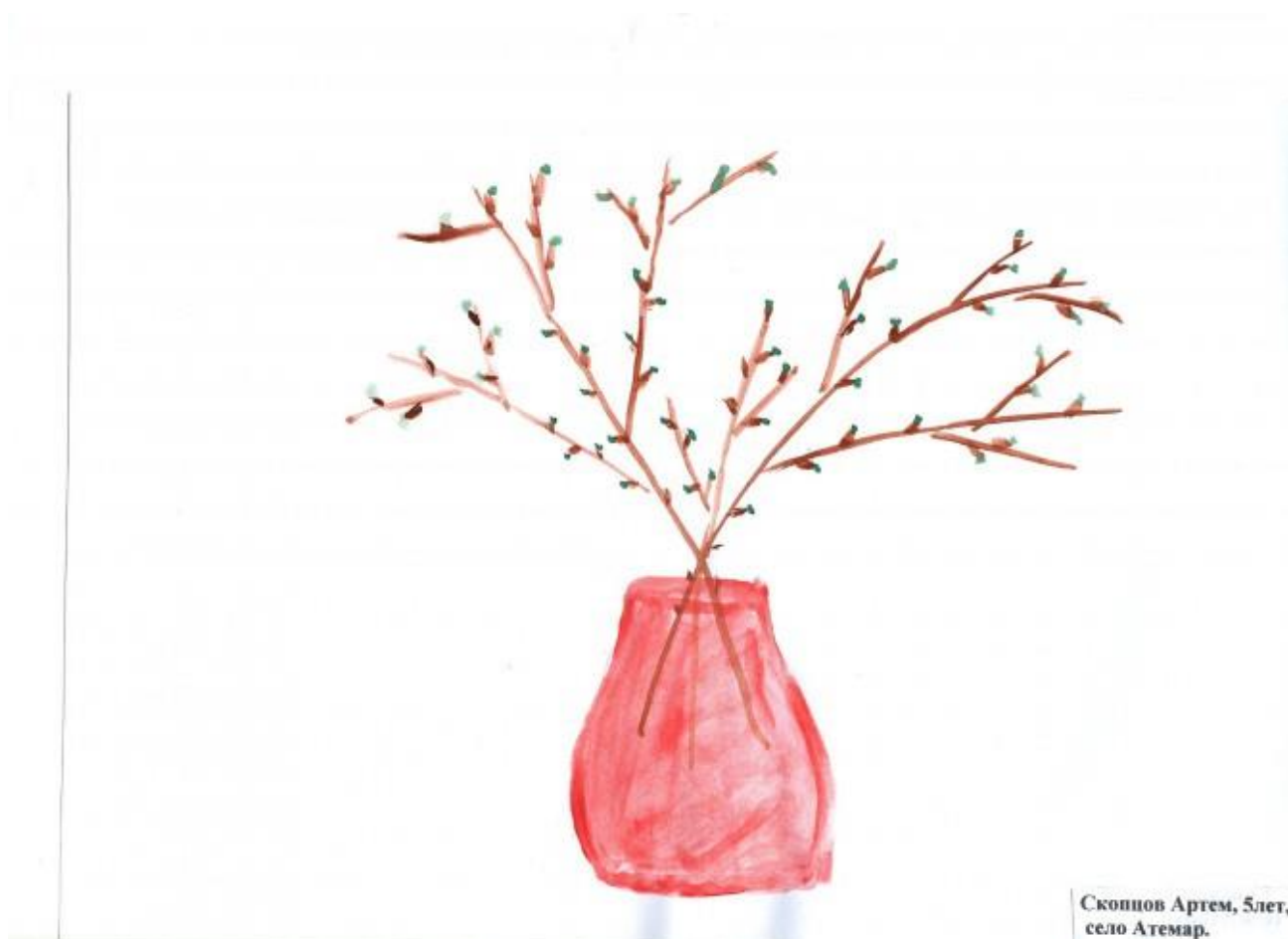
Скопцов Артем, 5 лет, село Атемар.

Промываем кисть от краски. Вытираем руки салфеткой.